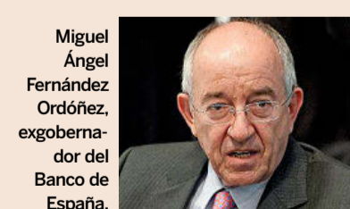
Miguel Ángel Fernández Ordóñez, exgobernador del Banco de España.