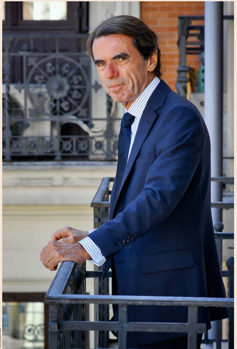
El expresidente José María Aznar en la sede de la Fundación FAES.

Si los líderes no acuerdan entre ellos objetivos políticos, los acabarán compartiendo los electores. No creo que sea necesaria una reforma electoral. Hasta ahora nuestro sistema electoral ha funcionado razonablemente bien. España era un país estable, con legislaturas duraderas. El problema no es el marco electoral sino la interpretación de los resultados electorales. Eso es lo que falla. Por eso sería bueno iniciar procesos de integración entre el centroizquierda por su parte y el centroderecha por la suya. Yo me he manifestado claramente a favor de la reconstrucción del centroderecha español. Yo ya lo hice en su momento, pero el ciclo ha vuelto a empezar, aunque con otras circunstancias distintas. Pero las recetas seguras que no son muy diferentes. Y mientras se produce eso, que requiere su tiempo, su camino, pues se puede avanzar en propósitos comunes que son los que dan tranquilidad y seguridad al país. No parece lógico