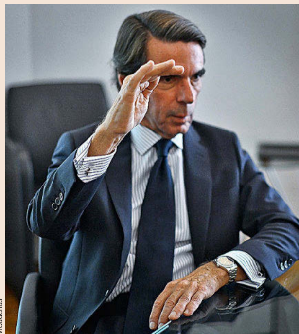
“Sigo pensando que la jubilación debe establecerse en los 70 años”.

Cuarenta años después hay que hacer un balance de eficiencias y deficiencias del estado de las autonomías. Ha sido muy útil, ha producido muy buenos resultados, pero no quiere decir que no tenga deficiencias, las tiene, y en algunos ámbitos muy seriamente, como lo que se refiere a la unidad de mercado, la competitividad, la educación... Y justamente ponemos el acento donde no debemos ponerlo: una sana competencia fiscal es muy buena para el sistema y una invitación a las autonomías a intentar igualarse por arriba en lugar de intentar igualarse por abajo como siempre es muy bueno. Hoy en el Estado, entre la insurrección en Cataluña, la presión nacionalista en el País Vasco y la presencia creciente de nacionalismos en otros territorios, junto con la debilidad evidente de los antiguos partidos nacionales, se produce una sensación de desbordamiento, de desarbolamiento. Ésta es una de las grandes cuestiones para la gobernabilidad de España; necesitamos un estado autonómico ordenado y hoy, por el contrario, lo que tenemos es desorden.