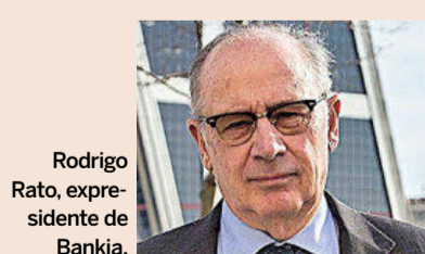
Rodrigo Rato, expresidente de Bankia.