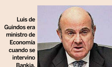
Luis de Guindos era ministro de Economía cuando se intervino Bankia.