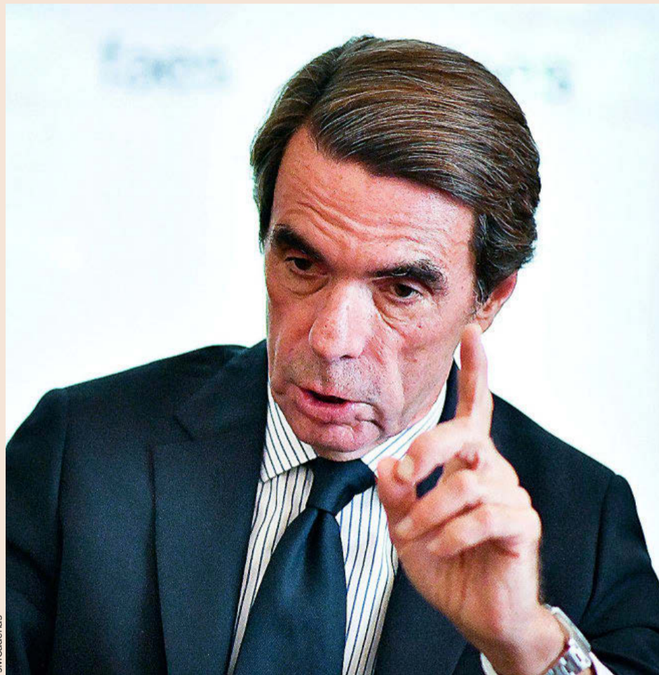
“La democracia liberal está en riesgo otra vez por la amenaza de los populismos”

Pues que curiosamente el triunfo de la libertad, de la democracia, del mundo libre está siendo cuestionado. Las democracias liberales triunfadoras están siendo cuestionadas por los derrotados con la caída del Muro de Berlín. Y ésa es una de las crisis que estamos viviendo en estos momentos. Hay que ver lo que era el mundo en 1990 y lo que es hoy. Cuántos millones de pobres había antes y cuántos ahora, cuánto ha cambiado en esos años la prosperidad del mundo, cuánto hemos avanzado económica y socialmente. El mundo es mucho mejor trein-